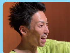
著者：岩井 智宏 桐蔭学園小学校教諭