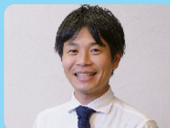
編著者：平野 次郎 筑波大学附属小学校教諭 筑波大学非常勤講師

「どの子どもどの先生も安心して歌の授業にのぞめる環境をつくること」という考えをもとにして、本書では様々な提案をしています。本書の活動・学習提案を参考に、先生方も目の前の子どもたちと楽しみながら活動してほしいと思います。