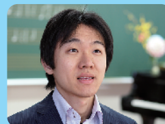
著者：松長 誠 埼玉県所沢市立中央小学校教諭

本書では、各ページにあるQRコードから実演動画・学習動画を参考視聴できます。デジタル教材「うた授業」に収録されている動画の一部をご覧いただけます。